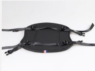
Respaldo ajustable (B)